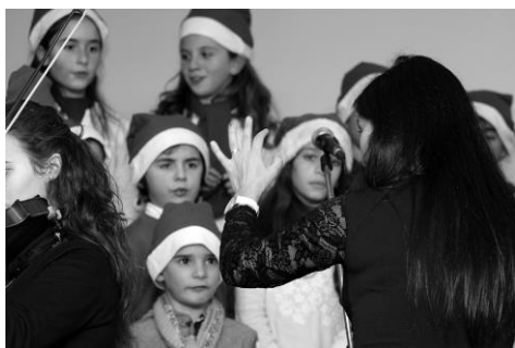
Coro Infantil de EMPrado